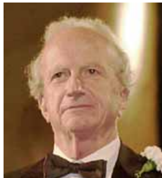
Gary Stanley Becker

L'estate, in Trentino, è all'insegna della cultura e si apre con il celebre Festival dell'Economia , in programma dal 30 maggio al 3 giugno, con la partecipazione speciale del premio Nobel Gary Stanley Becker . Dall'8 al 10 giugno, l'appuntamento è invece con Radio Incontri a Riva del Garda. E ancora, le montagne del Trentino e la musica si incontreranno nell'edizione 2007 de I Suoni delle Dolomiti, concerti ad alta quota , dal 30 giugno all'8