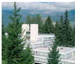
Il Solaria di Marilleva